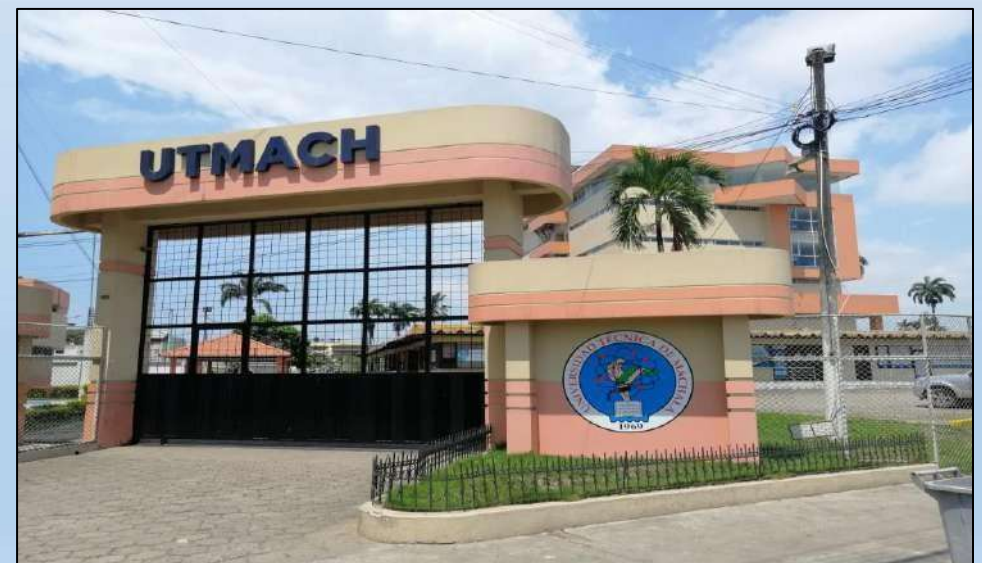
Campus Machala: Calle Loja entre 25 de Junio y 10 de Agosto