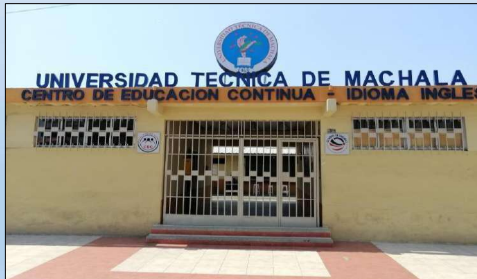
Campus 10 de Agosto: Calle 10 de Agosto y Marcel Laniado